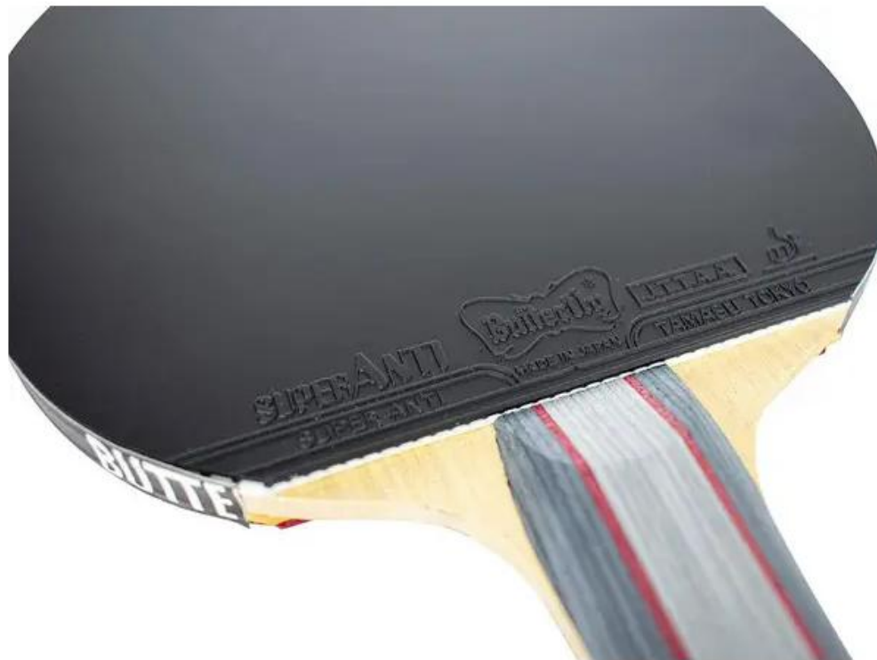
Photo: Butterfly Super Anti