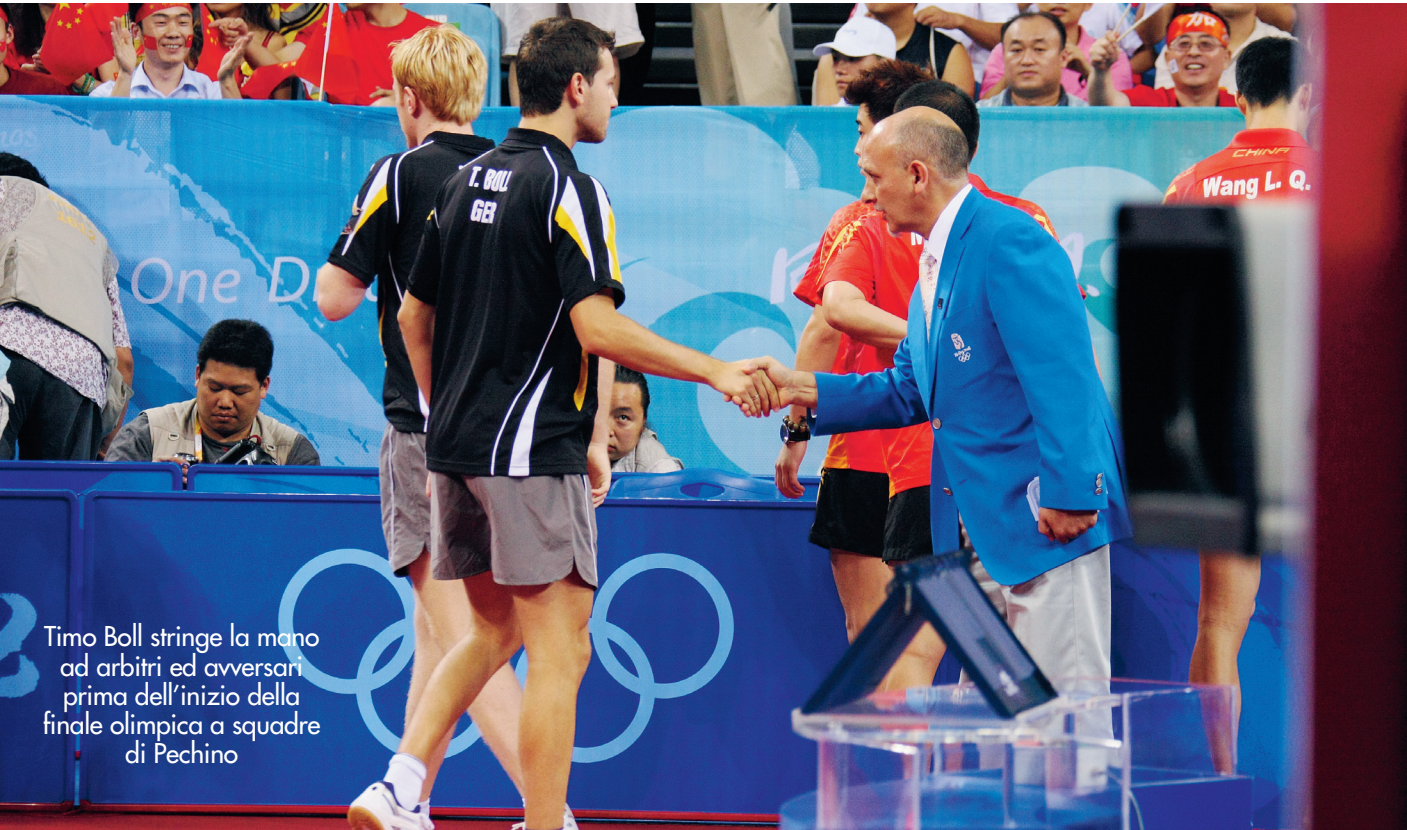
Timo Boll stringe la mano ad arbitri ed avversari prima dell'inizio della finale olimpica a squadre di Pechino